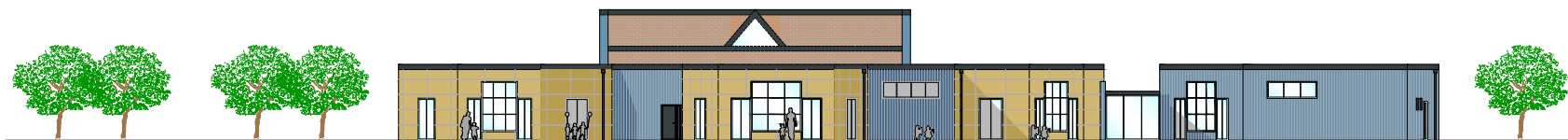
Prospetto sud 1:100