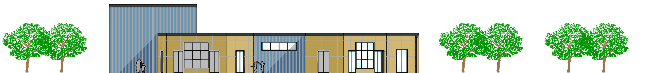
Prospetto ovest 1:100