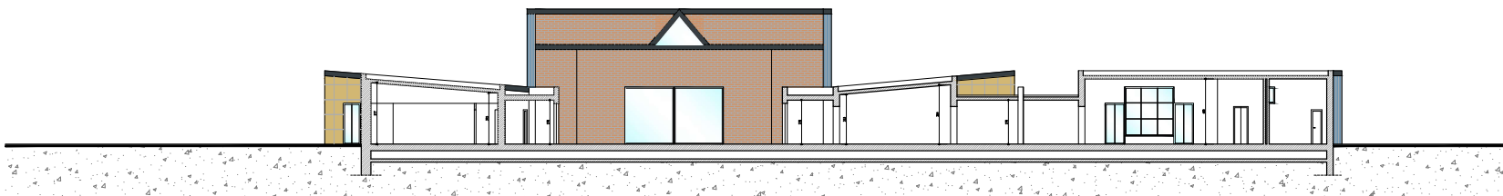
Sezione A-A 1:100